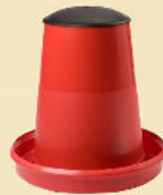
Futterautomat 12 kg mit und ohne FüÙe lieferbar