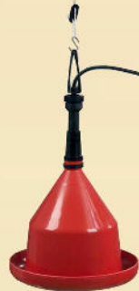
Niederdruck - Hängetränke