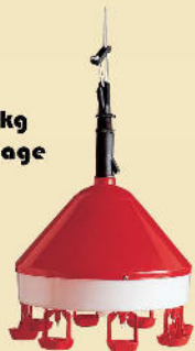
Niederdrucktränke mit 8 Nippeln