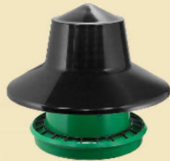
Futterautomat 25 kg inkl. Regenhut