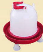
Tränken inkl. 4 FüÙe Inhalt: 3 liter, 6 liter oder 12 liter