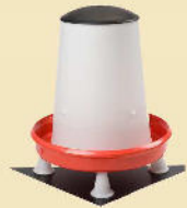
Futterautomat 12 kg inkl. 4 FüÙe