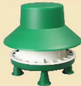
Futterautomaten mit FüÙen in verschiedenen Größen mit Regenhut