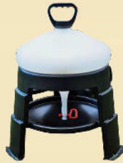
Kunststofftränke Inhalt 10 liter, 20 liter und 30 liter